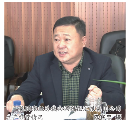
张旭总裁调研指导